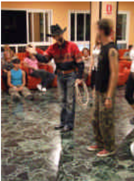
Chatti the Valley dans action