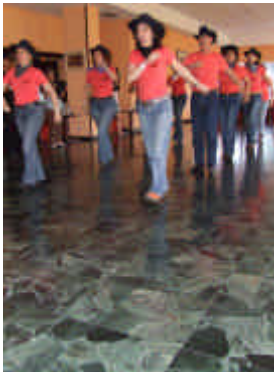
Le ProAline de Sant Jordi (Mallorca)