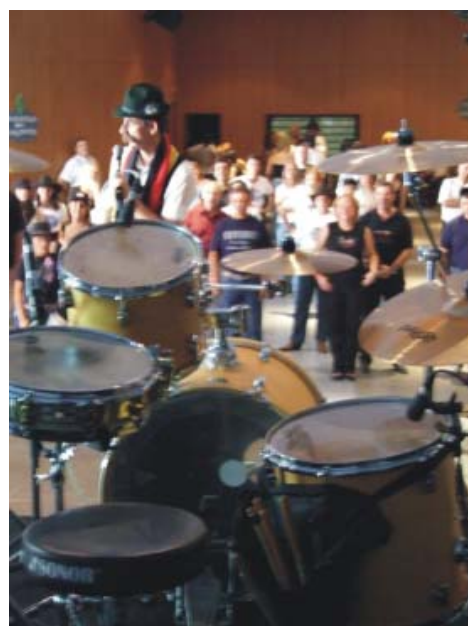
Clase Hans Fritz Von Zwiebel Suppe