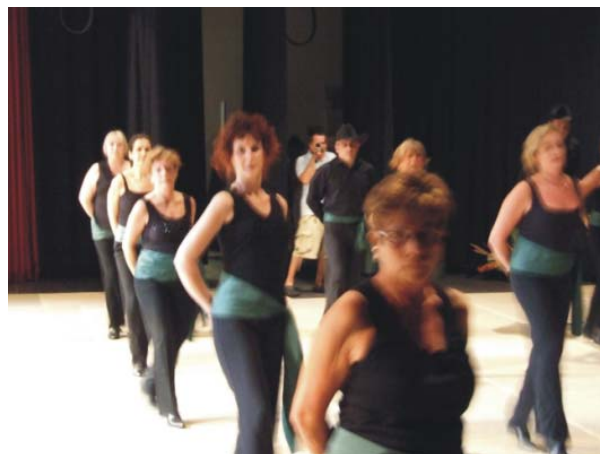
Exhibicion Andorra Dancers